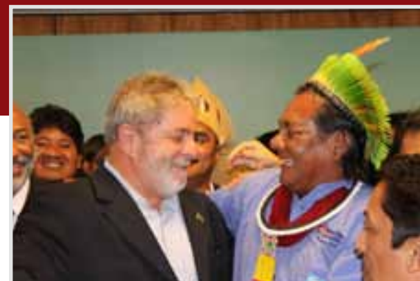
Lula assina decreto que oficializa a criação da Secretaria de Saúde Indígena: uma vitória dos movimentos indígena e indigenista!

para que a Funasa pudesse definir os tipos de convênios e as atribuições dos prestadores de serviços. Posteriormente foram realizadas mais duas conferências de saúde indígena (2000 e 2006), mas ambas foram conduzidas pelos agentes da Funasa com o objetivo de referendar a perspectiva da terceirização e a diminuição ou restrição à participação indígena no controle social.